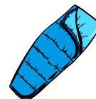
Nécessaire de couchage (coussins, couvertures, sacs de couchage...)

Attention ! Les nuitées sont fraîches, on vous recommande vivement d'emmener un plaid ou autre à mettre en dessous de votre sac de couchage.